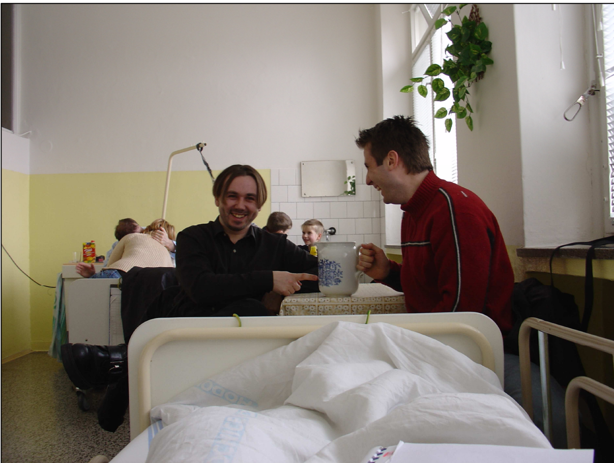
Ondra na levo je fotograf a grafik, Martin je grafik a fotograf. Není to Pat a Mat. Jejich názory jsou pro mne důležité.