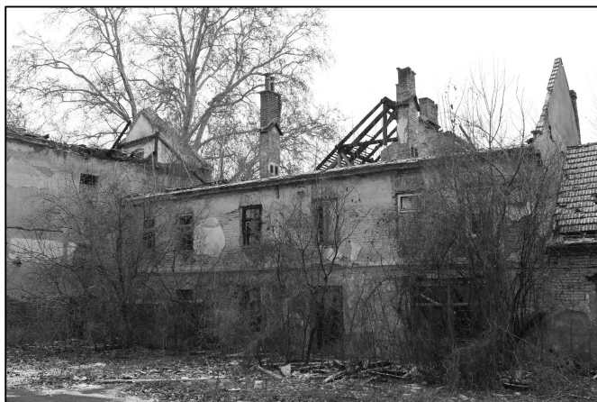
Tady je bezdomovci uklizeno