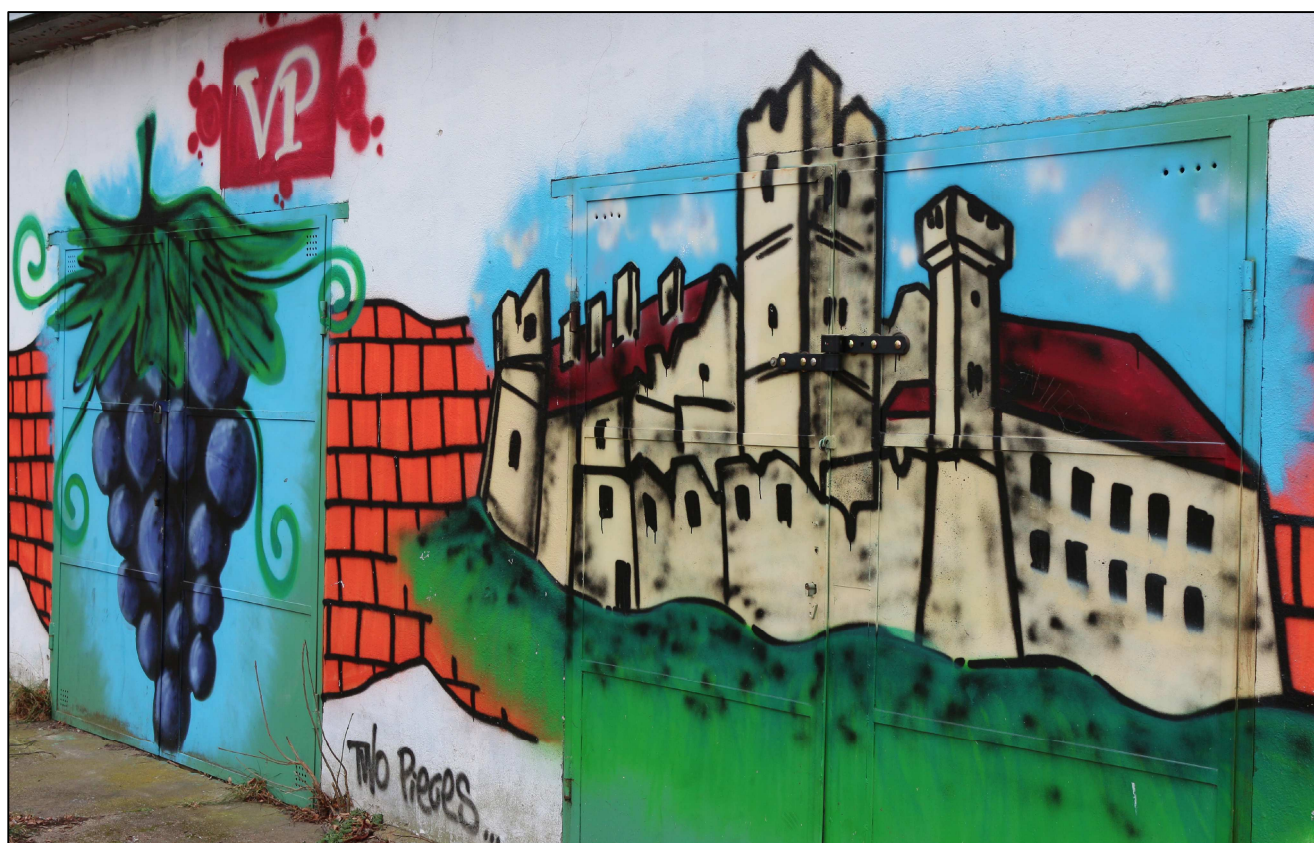
Zámek Břeclav – hezky znázorněný na přilehlé garáži.

Ve firmě VHS Břeclav jsem pracoval téměř dva roky na projektu Generální rekonstrukce kanalizace a čistírny odpadních vod přímo v Břeclavi. Zde je litinová trubka vodovodu, kterou pokládají pracovníci VHS Břeclav.